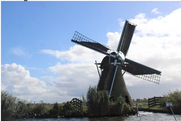
molen de Kok

Via de Laeck en de Kagerplassen varen we naar de Kokmolen, gebouwd in 1809. Ook een stenen grondzeiler maar met een schitterende flessenhalsvorm en een platte zijde voor het scheprad. Ook deze molen heeft geen steunder. Molen De kok en de Laeck bemalen beiden nog de polder.