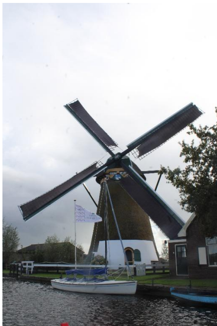
molen de Zwanburger

Op deze molen werden we tevens verrast met koffie/thee en appeltaart maar dat smaakte heerlijk na een boottocht van anderhalf uur. De Zwanburgermolen is gebouwd in 1805. Een schitterende grote ronde stenen molen die vroeger bewoond was. De inrichting zit er nog in. Deze molen was tevens de eerste molen van de Rijnlandse molenstichting. De huidige as is van de gesloopte wipmolen van De landen van essche bij Strijen. De molen heeft een ijzeren scheprad met diameter 5.50 meter.