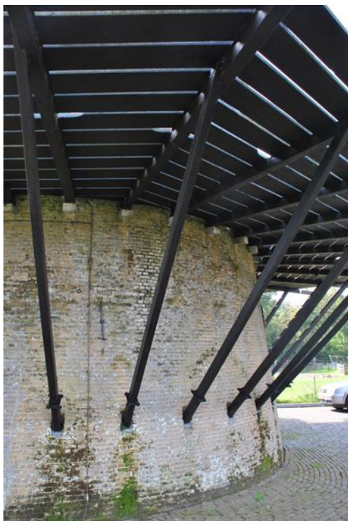
Afb.1 Stelling van een ronde stenen molen. Onder elke ligger een schoor , die steunt op een vink of console . Onderaan de schoren leklatjes N.B.: Ook de liggers steunen hier op consoles ! (d'Arke - Oostkapelle)