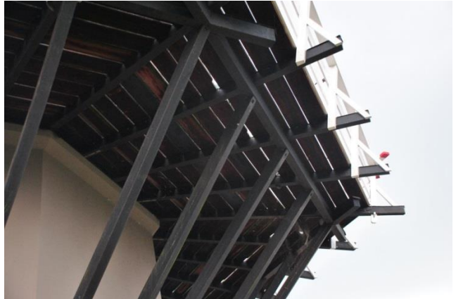
Afb. 6 Onder elke ligger een schoor en ook nog een buitensluiting . En een soort binnensluiting . (Molen de Hoop – Bunschoten)