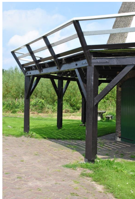
Afb. 2 Een lage stelling , ondersteund door stutten . Deze zijn voorzien van hulpstutten of kraaienpoten . Tussen de stutten een buitensluiting (Windesheimer Molen – Zwolle)