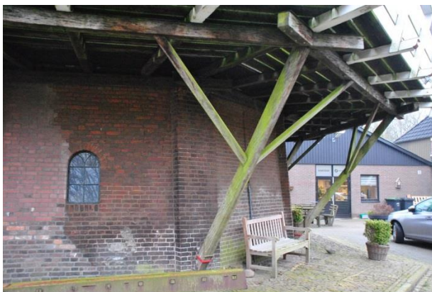
Afb. 9 Schooren (géén stutten!) met kraaienpoten . Verder zowel een (houten) binnen- als buitensluiting . (De Hoop – Wachtum)