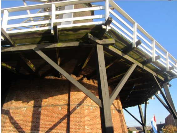
Afb. 5 Bij stellingstutten met hulpstutten (of kraaienpoten ) wordt een buitensluiting toegepast. (De Braakmolen – Goor).