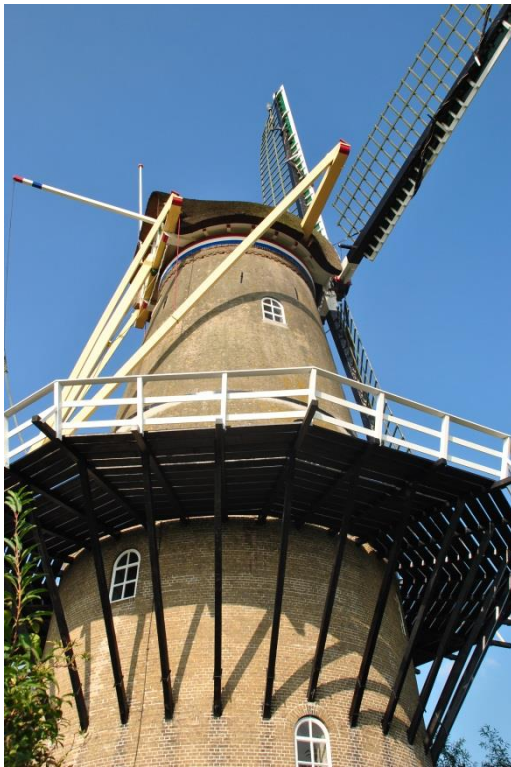
Afb. 3 Elke ligger wordt ondersteund door een schoor . Evenveel liggers als schoren ! (Den Arend – Bergambacht)

b - de liggers worden ondersteund door een buitensluiting , die zelf weer wordt ondersteund door schoren of stutten (afb.2 en 4)