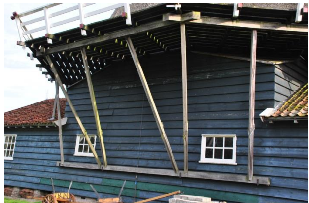
Afb. 10 Een stelling met buitensluiting en ondersluiting . (De Bolwerksmolen – Deventer)