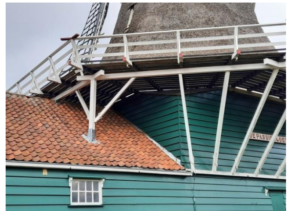
Afb. 8 Een binnensluiting , buitensluiting en ondersluiting . Links, bij het dak een stut met kraaienpoten . (Oliemolen De Passiebloem – Zwolle)