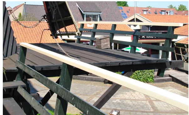
Afb. 14 Vanaf het schavot worden de zeilen bediend. (Paltrokmolen De Held Jozua – Zaandam)