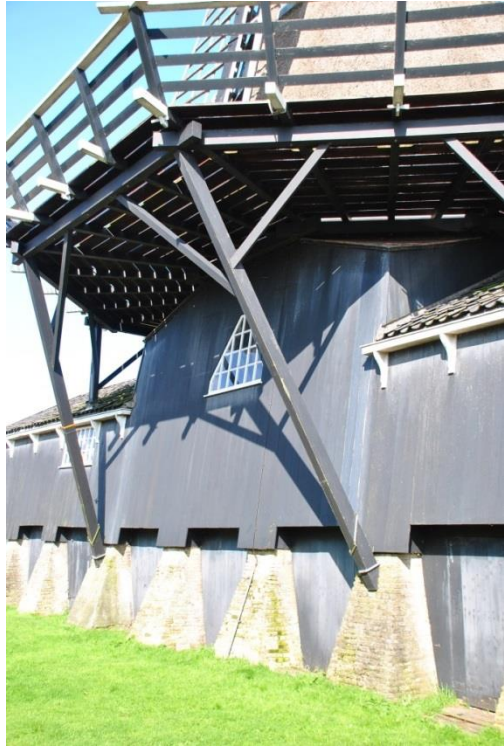
Afb. 11 Een stelling met buitensluiting en schoren met kraaienpoten die steunen op de stiepen (poeren). Bij het dak stutten met kraaienpoten . (Zaagmolen De Jager – Woudsend)