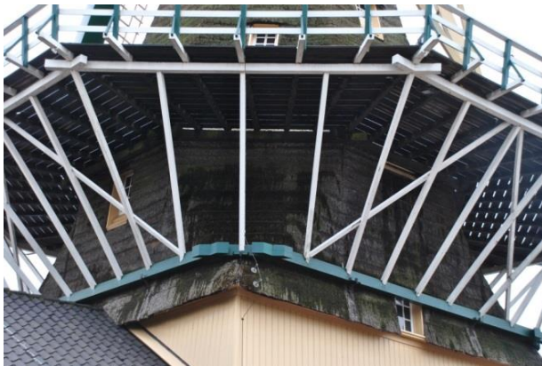
Afb. 7 Een ondersluiting (groen) waarop de schooren rusten en een buitensluiting (wit). De binnensluiting is niet goed zichtbaar. Veel schooren , nog meer liggers ! (Zaagmolen De Heesterboom – Leiden)