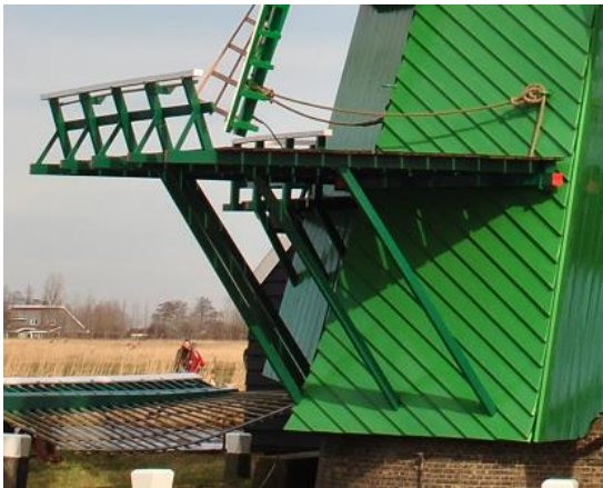
Afb. 13 Een schavot met binnensluiting en schoren . (Paltrokmolen De Poelenburg – Zaandam)

Een paltrokmolen heeft geen stelling, maar een schavot , om de zeilen te kunnen bedienen.